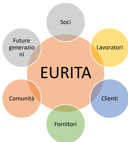
Figura 1: Stakeholders di Eurita identificati nel 2023

Si è utilizzato un management tool, disponibile al sito https://app.bimpactassessment.net/ ed utilizzato da oltre 50.000 aziende in tutto il mondo, tra cui oltre 3.000 B Corp certificate. Tale strumento ci ha consentito una prima autovalutazione circa l'impatto dell'attività su vari stakeholders aziendali identificati nei Soci, nei Lavoratori, nei Clienti, nei Fornitori, nella Comunità e nelle future generazioni.